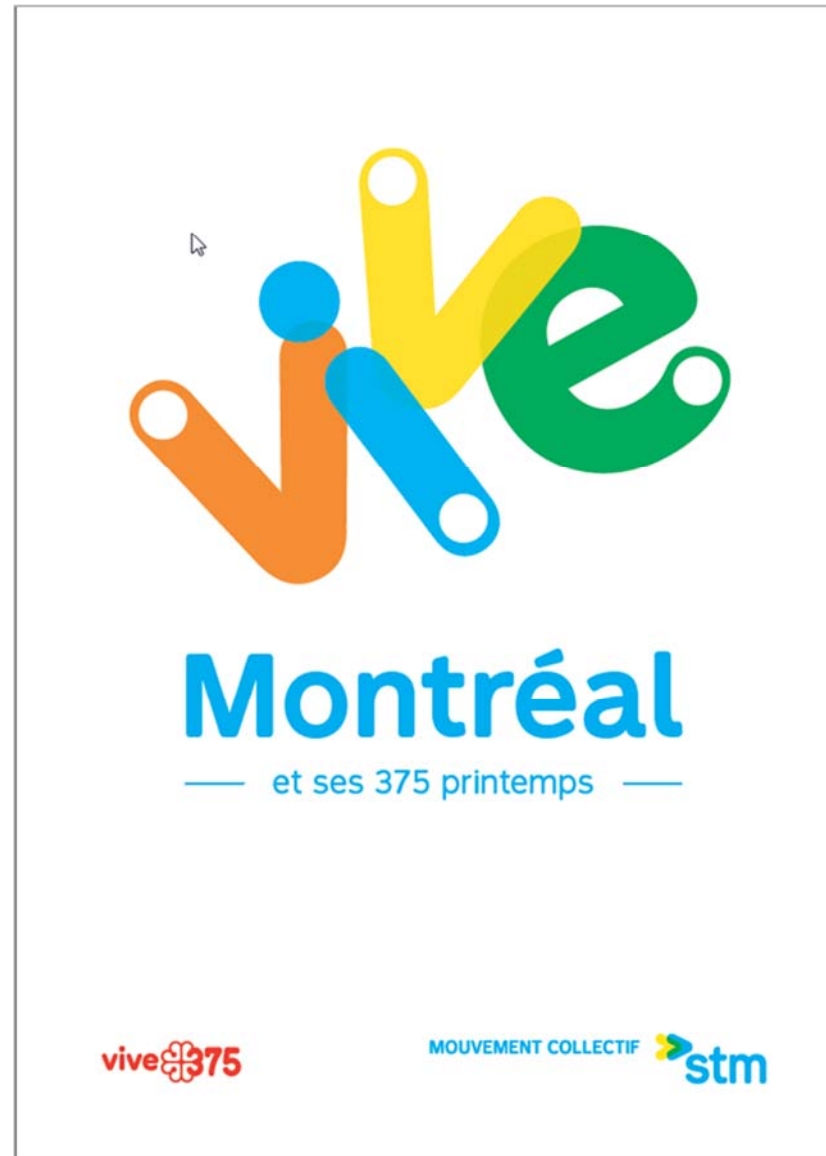
Backlit ads - transit shelters Montréal celebrates its 375 th birthday